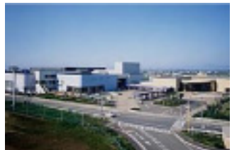
4 リージョンプラザ上越