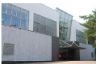
7 上越市立高田図書館