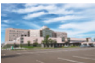
6 新潟県立中央病院