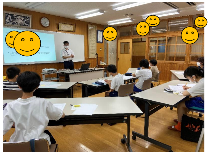
写真1 障害理解授業の研修会および交流会の様子 （糸魚川市立糸魚川東中学校難聴通級指導教室／上越市立大町小学校難聴通級指導教室）