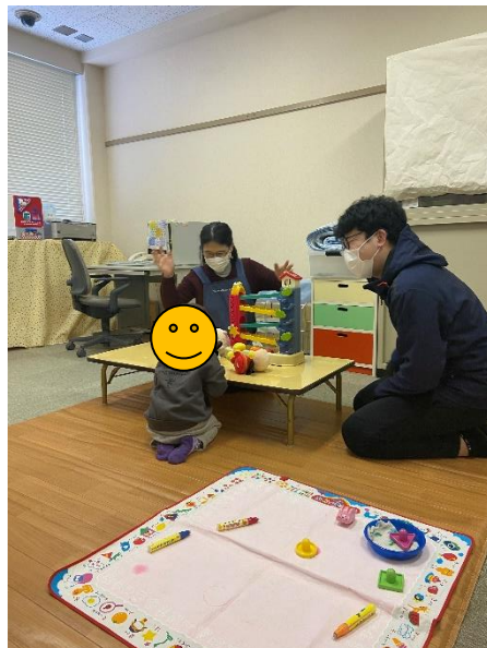
写真1 きこえ相談での活動の様子 (上越教育大学特別支援教育実践研究センター)