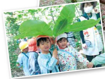
園庭の木になる実は、採って食べることもできます。