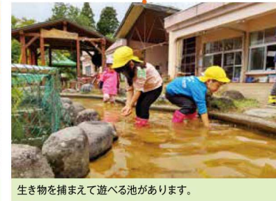
生き物を捕まえて遊べる池があります。