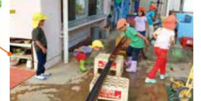
いろいろな道具を使って遊んでいます。