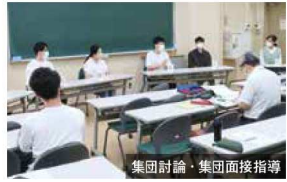
集団討論・集団面接指導