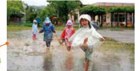
雨の日でも外で元気に遊んでいます。