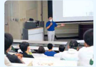
上: キャンパスツアーで案内をする学生スタッフと参加者 下: ミニ講義で登壇した水落副学長