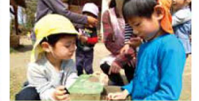
異年齢でかかかって遊んでいます。