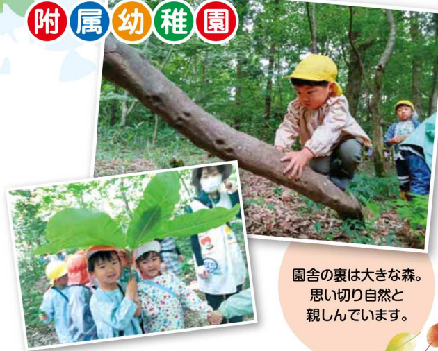
園舎の裏は大きな森。思い切り自然と親しんでいます。

幼児にとって、遊びは「学び」。生きる力の基礎を育むため、幼児の主体的な遊びを大切にしている園です。職員は「幼児は自ら育とうとする存在である」という子ども観のもと、幼児の育ちを支える保育に、日々愛情と情熱を注いでいます。