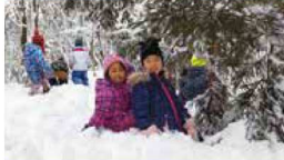
四季折々の遊びが楽しめます。