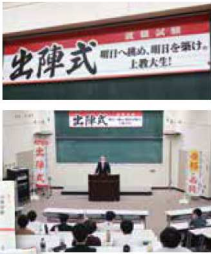
合格祈願の激励グッズ