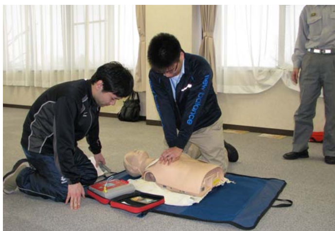
（AEDを用いた心肺蘇生の実習）

この講習会は，平常時はもとより，大規模災害発生時に想定されるけが人に対し，救急車等が到着するまでの間，その場に居合わせた者が即応できるための応急手当の知識，技能を取得することを目的として，救命講習，心肺蘇生，止血処置及びAEDを用いた応急手当について，所轄消防署救急隊による指導の下，教職員及び学生23名の参加により実施した。