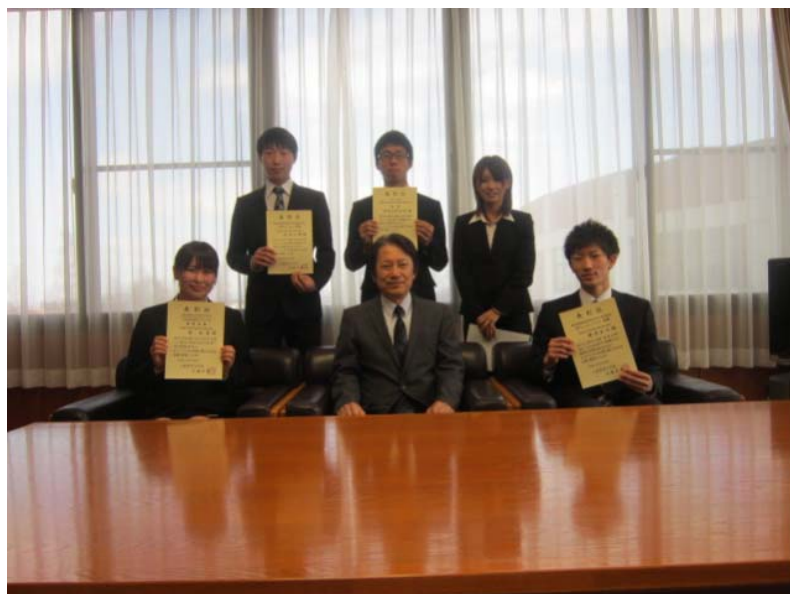
(表彰式終了後、学長を囲んで記念撮影する被表彰者一同)